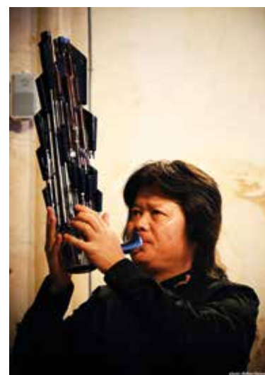
Sheng (orgue à bouche)