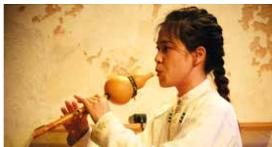
Halusi (flute à courge)