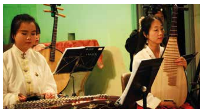
Yangqin (cithare) et Pipa (luth)