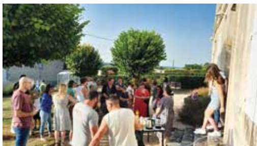
Rentrée des classes, accueil des parents

Cantine avec plats « faits maison » et garderie gratuite accompagnent un enseignement de qualité.